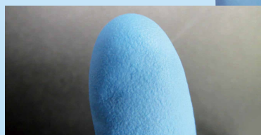
手型を変更し、滑り止めを付けました