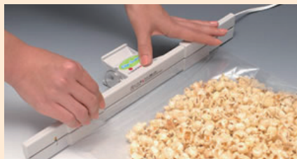
クリップシーラー® A-1